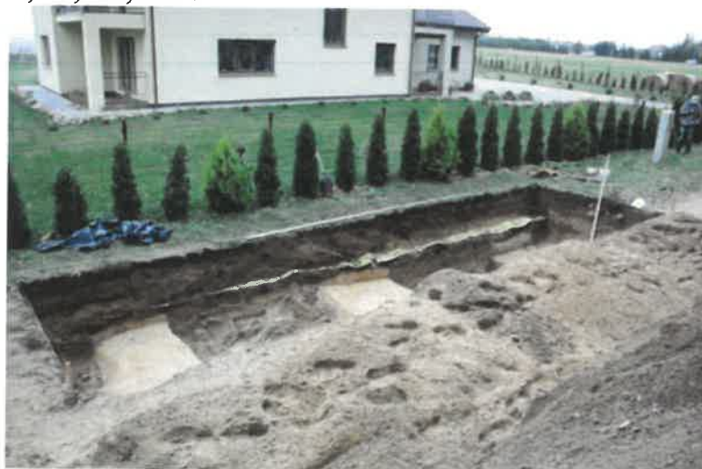
Perkasa Nr. 2, gylis 1-1,6 m, iš PR