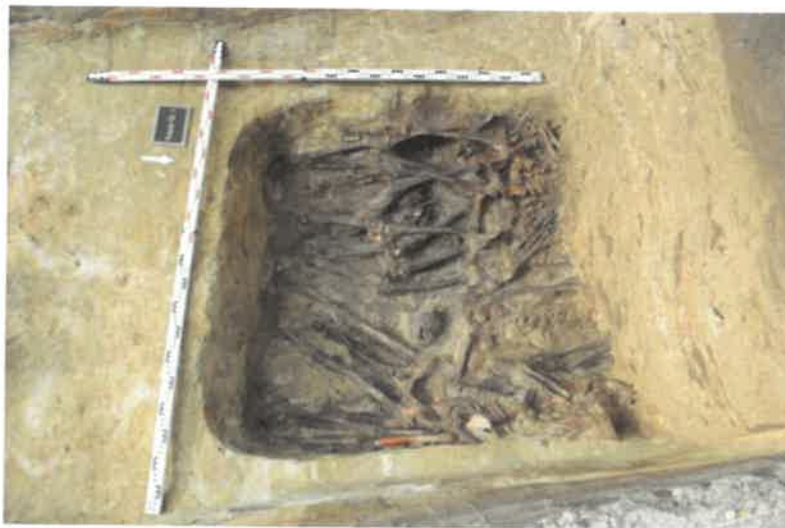
Masinis kapas Nr. 1, gylis 1,7-1,8 m iš R